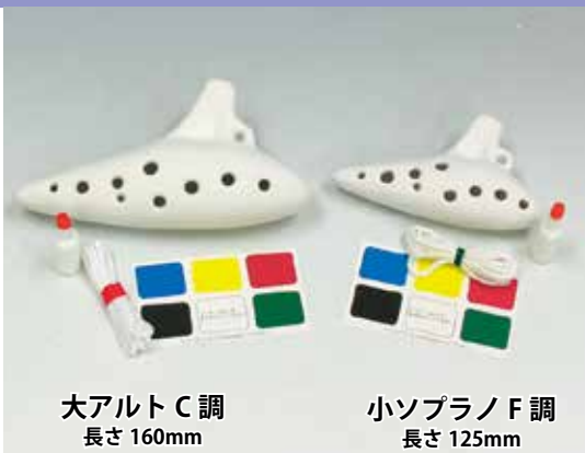
大アルト C 調 長さ 160mm

表面に直接鉛筆などで下絵を描き、アクリル絵の具、顔料系マーカー、クレヨン、色鉛筆など何でも描くことができます。付属の水性ニスを最後に表面に塗れば完成です。