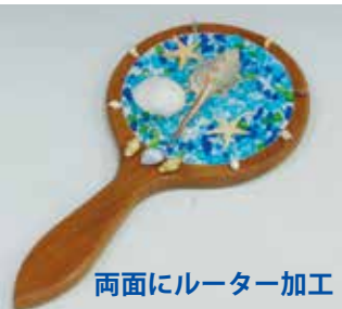
両面にルーター加工