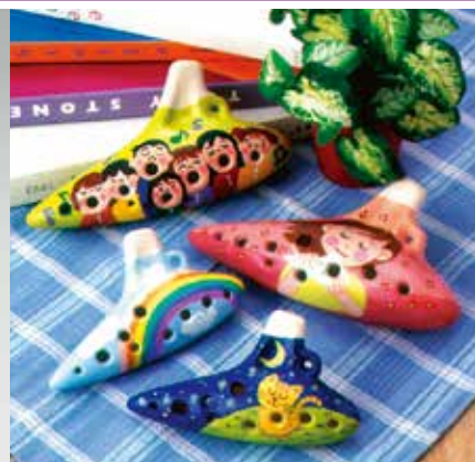
小ソプラノF調 長さ125mm