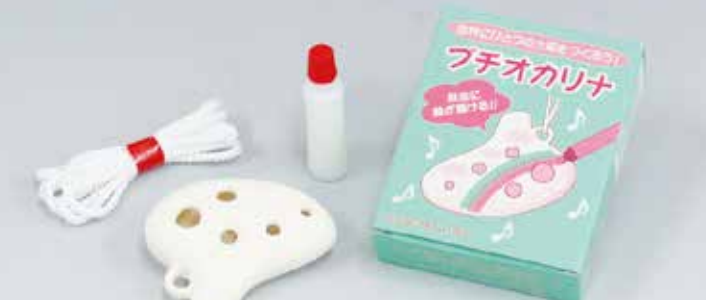
サイズ：55 × 45mm