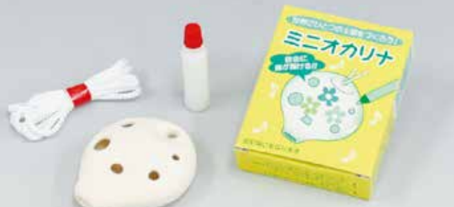
サイズ：58 × 48mm