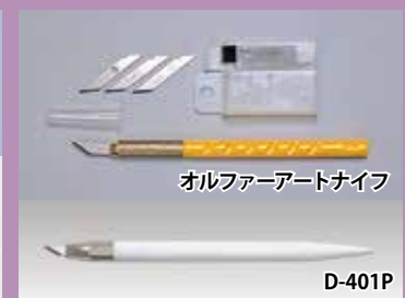
オルファアーツナイフ