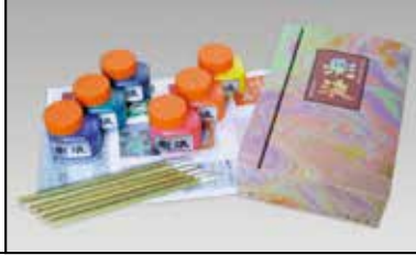
マーブリング彩液セット