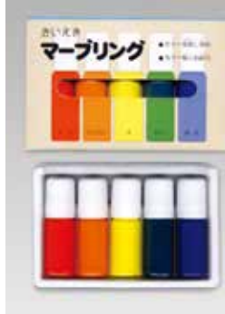
マーブリングセット5色