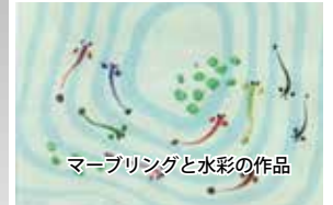
マーブリングと水彩の作品