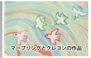
マーブリングとクレヨンの作品