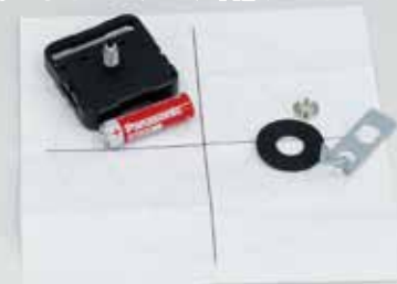
スイープ運針 (なめらかに連続して動く)