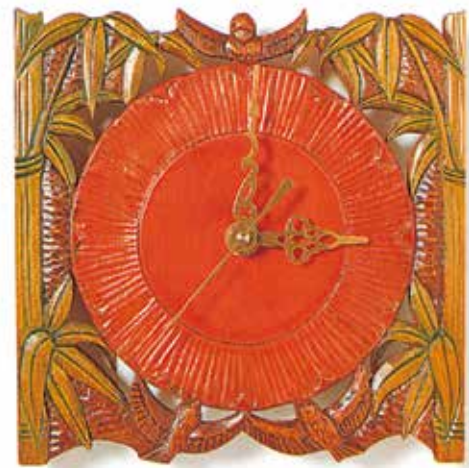
推奨ユニット：デザインクロック M デザインクロックスイープ