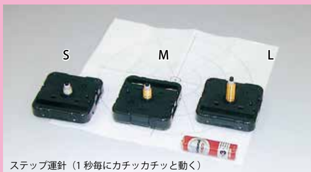
ステップ運針 (1秒毎にカチッカチッと動く)