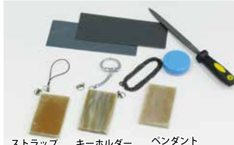
ストラップ キーホルダー ペンダント

オランダ水牛角 (60 × 35 × 5mm) 1個 金具 1個 (ストラップ、キーホルダー、ペンダント、チャームいずれか) 耐水ペーパー (荒、細、110 × 40mm) 2枚 棒やすり 1本 研磨剤 (5g) 1個