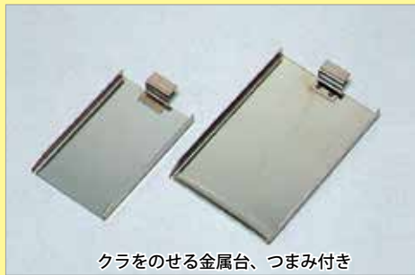
クラをのせる金属台、つまみ付き