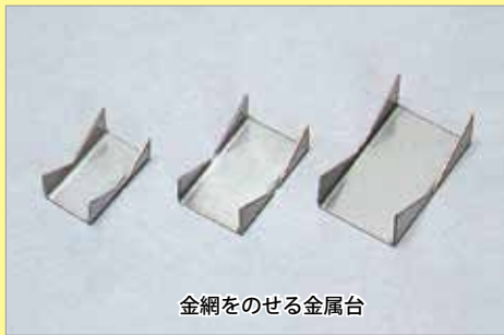
金網をのせる金属台