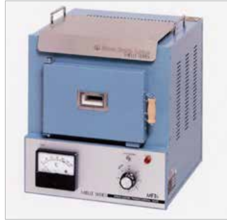
7001 MF-3 ----- ￥128,700+税

7002 MF-3S ----- ￥137,500+税 消費電力：1KW、100V、10A 最高温度：1,000℃ 炉内寸法：幅 160 × 高 85 × 奥行 200mm 外型寸法：幅 310 × 高 350 × 奥行 340mm 重量：10kg