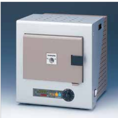
7034 スーパー 500T ----- ￥239,800+税

炉内寸法：W230 × H90 × D300mm 外形寸法：W400 × H355 × D460mm 消費電力：1.4kW (100V, 14A) 最高温度：999℃ 重量：18kg