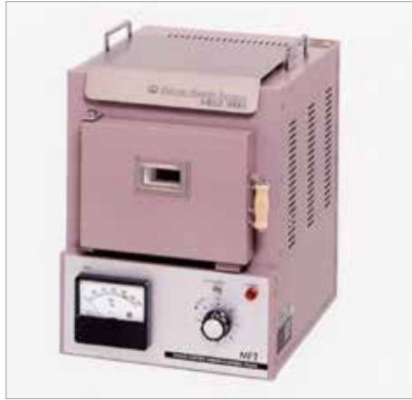
7000 MF-2 ----- ￥104,500+税

ステンレス製乾燥台が全面上部に付き大きな覗き穴が付いています。普通コンセント使用