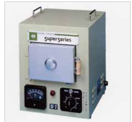
7008 SF-2 ----- ￥92,400+税

炉内が広く、水差し、花瓶、茶器、香合等、立体的なものに便利です。2S型は、三面ヒーター方式（天上、両側）ですので、焼成ムラがありません。