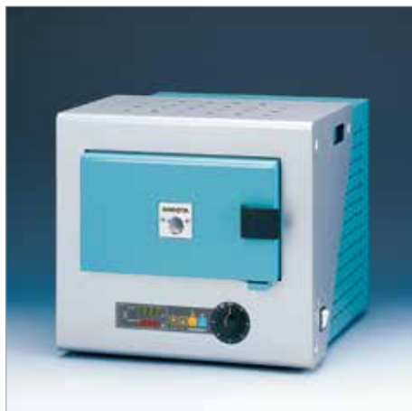
7036 スーパー 400T ----- ￥234,300+税

炉内寸法：W160 × H85 × D200mm 外形寸法：W330 × H335 × D380mm 消費電力：1.0kW (100V, 10A) 最高温度：999℃ 重量：14kg、15kg (300S)