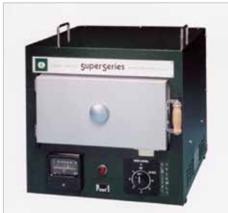
7005 ピクチャー 1 ----- ￥149,600+税

炉内寸法：幅 230 × 高 90 × 奥行 300mm 外型寸法：幅 350 × 高 340 × 奥行 460mm 消費電力：1.3KW、100V、13A 最高温度：1,000℃ 重量：16kg