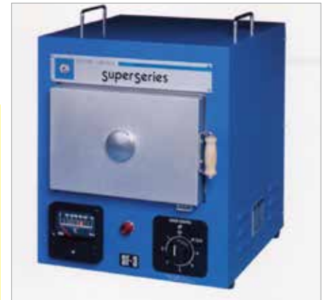
7009 SF-3 ----- ￥118,800+税

炉内寸法：幅 120 × 高 80 × 奥行 190mm 外型寸法：幅 260 × 高 330 × 奥行 310mm 消費電力：700W、100V、7A 最高温度：1,000℃ 重量：8kg 標準型。最もポピュラーな手ごろな大きさです。