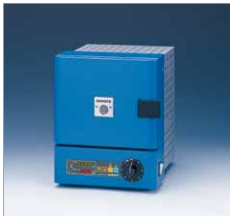
7031 スーパー 200T ----- ￥183,700+税

炉内寸法：W85 × H60 × D120mm 外形寸法：W185 × H225 × D230mm 消費電力：400W (100V, 4A) 最高温度：999℃ 重量：4kg セラミックボード付き