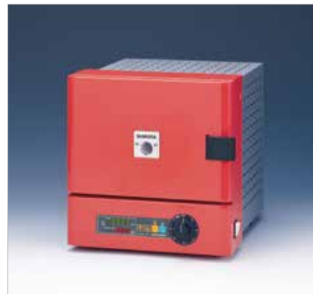
7032 スーパー 300T ----- ￥195,800+税

炉内寸法：W120 × H80 × D170mm 外形寸法：W275 × H330 × D330mm 消費電力：700W (100V, 7A) 最高温度：999℃ 重量：10kg