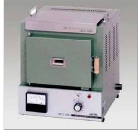
7003 MF-P2 ----- ￥172,700+税

7004 MF-P2S ----- ￥184,800+税 消費電力：1.3KW、100V、13A 最高温度：1,000℃ 炉内寸法：幅 200 × 高 130 × 奥行 240mm 外型寸法：幅 350 × 高 405 × 奥行 410mm 重量：15kg (MF-P2) 16kg (MF-P2S)