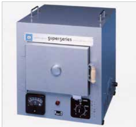
7006 ピクチャー 2 ----- ￥167,200+税

7014 ピクチャー 2S ----- ￥173,800+税 消費電力：1.3KW、100V、13A 最高温度：1,000℃ 炉内寸法：幅 200 × 高 130 × 奥行 240mm 外型寸法：幅 350 × 高 385 × 奥行 400mm 重量：15kg/ピクチャー 2 16kg/ピクチャー 2S