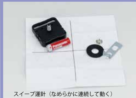
スワイプ運針 (なめらかに連続して動く)