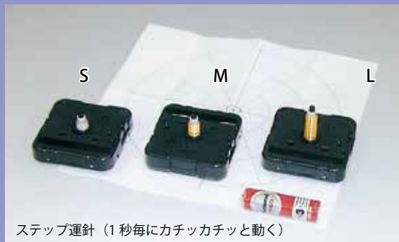
ステップ運針 (1秒毎にカチッカチッと動く)