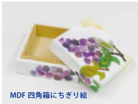
MDF 四角箱にちぎり絵