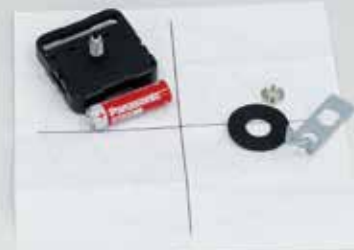
スイープ運針 (なめらかに連続して動く)