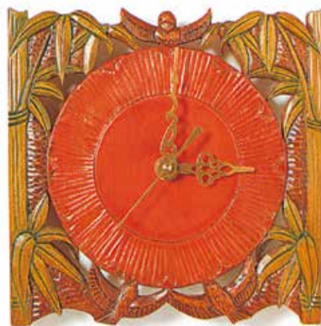
推奨ユニット：デザインクロック M デザインクロックスイーブ