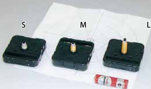
ステップ運針 (1秒毎にカチカチと動く)