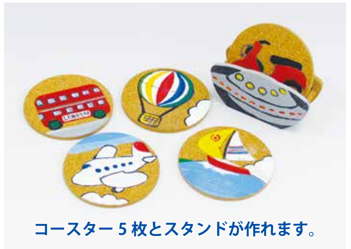
コースター5枚とスタンドが作れます。