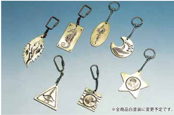
※全商品白塗装に変更予定です。