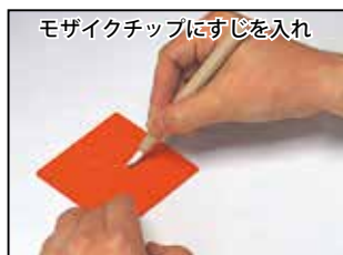
モザイクチップにすじを入れ 手で割る 手で割る 切断したい直線や曲線をカッターナイフでモザイクチップにすじを入れ、手で割るとその通りに割れます。ただし、あまり複雑な線やカーブのきつい曲線はできません。