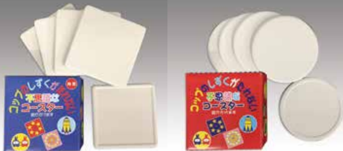
サイズ：90 × 90 × 5mm

<応用> アクリル絵の具、シルクスクリーン、ステンシル、ドライポイント、エッチング、電気ペンによる焼き絵の技法が可能です。Aはミニフレームにも入ります。