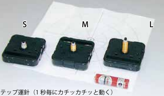
ステップ運針 (1秒毎にカチッカチッと動く)