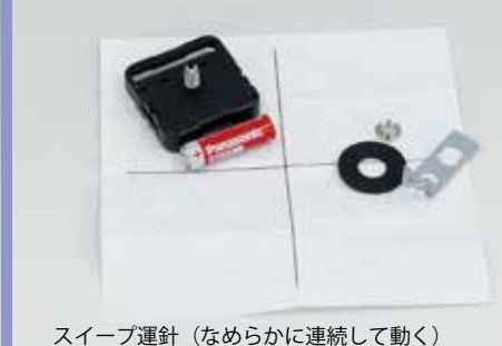
スイープ運針 (なめらかに連続して動く)