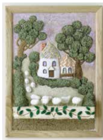
絵の具のように「塗る・盛る」 砂絵のように「振る」