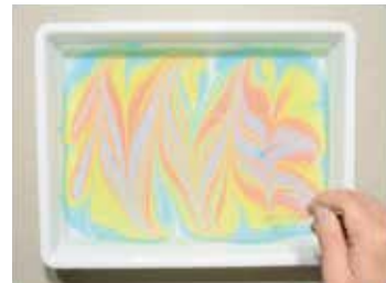
2. 竹串でタテ・ヨコ・ナナメと自由に模様をつくる。