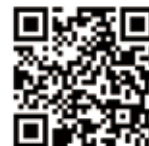
マーブリングデコ