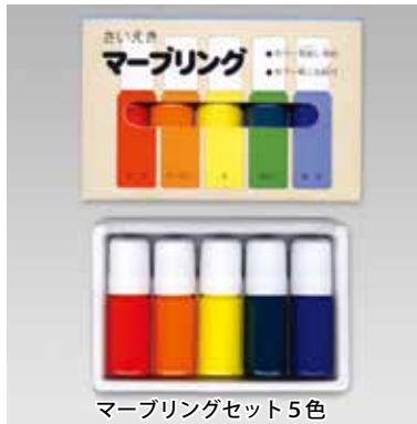
マーブリングセット 5色

パットなどに水を張り、フロート紙を浮かせ、その上に液を乗せます。フロート紙を鉛筆の先などで静かに沈め、水面をかき回してマーブル模様を作り、水面に紙などをかぶせて模様を吸い取ります。