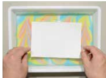
3. マーブリングを写したい部分に紙をのせる。