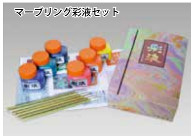
マーブリング彩液セット