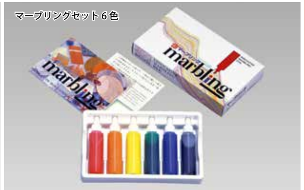
マーブリングセット 6色