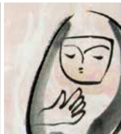
マーブリングとクレヨンの作品