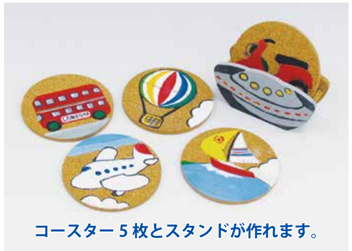
コースター5枚とスタンドが作れます。