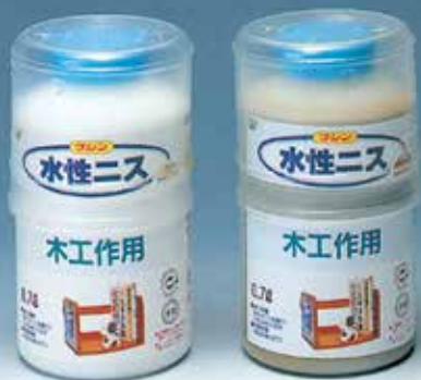
F☆☆☆☆ アクリル系エマルジョン塗料