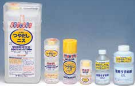
F☆☆☆☆ 水溶性アクリル樹脂塗料