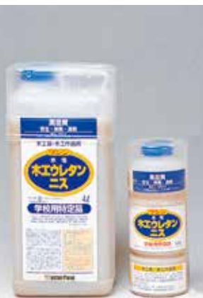
被膜が硬く、耐水性があります