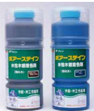
溶き容器付き F☆☆☆☆ 顔料着色剤