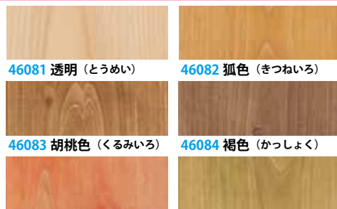
46081 透明 (とうめい)