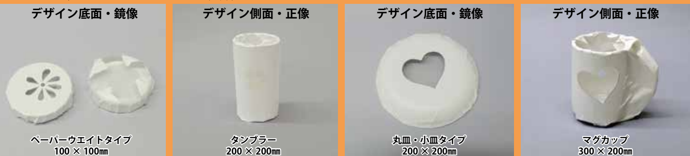
ペーパーウェイトタイプ 100 × 100mm タンブラー 200 × 200mm 丸皿・小皿タイプ 200 × 200mm マグカップ 300 × 200mm

サンドブラスト用ビニールテープのマスキング方法例 コンプレッサーで圧力をかけた空気に砂を混ぜて噴射するのでしっかりとマスキングしてください。