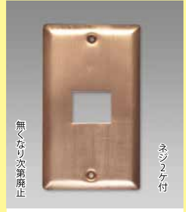
コンセントプレート (裏引未) 2530 ----- ¥ 330 ¥ 300 プレス加工済 73 × 123mm