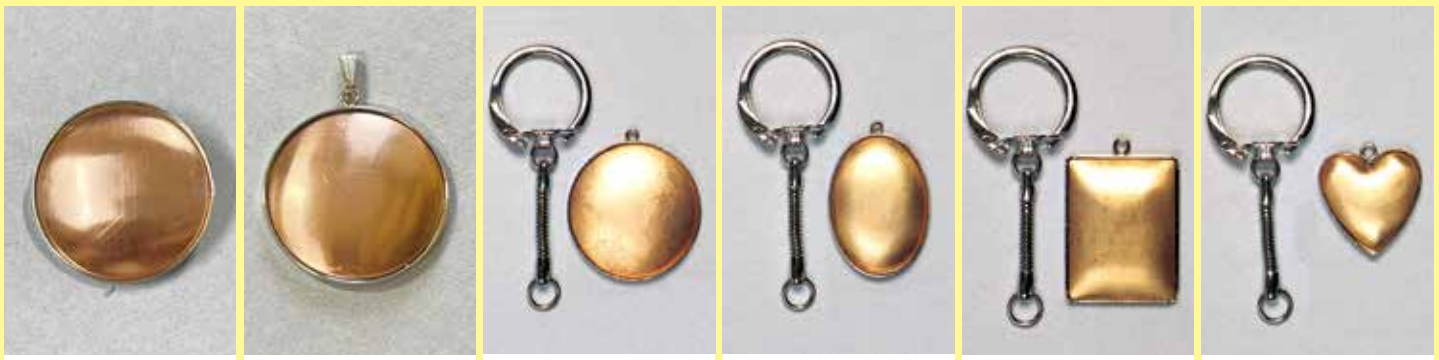
3101 ブローチ丸型 φ 30mm シルバー ¥ 418 ¥ 380 3201 ペンダント丸型 φ 30mm シルバー ¥ 286 ¥ 260 3701 キーホルダー丸型 φ 32mm シルバー ¥ 352 ¥ 320 3702 キーホルダー小判型 23 × 32mm シルバー ¥ 352 ¥ 320 3703 キーホルダー角型 24 × 31mm シルバー ¥ 385 ¥ 350 3704 キーホルダーハート 22 × 20mm シルバー ¥ 253 ¥ 230

絵画・画材 デザイン 工芸・民芸 版画・染色 木彫・木工芸 てん刻 彫塑・彫刻 陶芸 ガラス工芸 金属工芸 皮革工芸 七宝焼 資料 備品