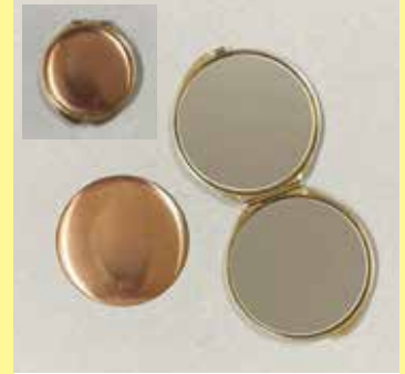
3901 ダブルミラー丸型 銅板サイズ φ 55mm (裏引未) ケース色ゴールド、中は両面鏡です ¥ 968 ¥ 880