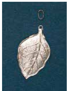
1804 さくら 16 × 24mm ¥660 ¥600 (純銀ペンダント)

① 750℃～800℃の炉で1～2分空焼きして、表面の油分などを取りのぞきます。② 裏面に CMC 溶液を筆で塗り、裏引きにする絵の具（銀用白透絵の具が最適）を薄く盛り、750℃～800℃の炉で焼成します。表面に赤系、紫系の絵の具を使う場合は、発色が悪くなるので、表面にも銀用白透を盛って焼成します。③ デザインに合わせて、銀用絵の具で施釉・焼成します。④ 2～3度、施釉・焼成し、色の濃淡を出して完成です。※ 1827、1828 は裏引きは必要ありません。