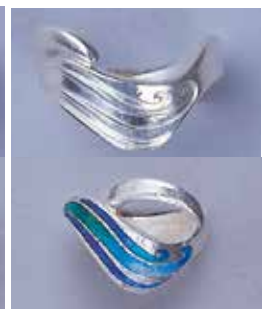
1828 波模様 φ 20mm ¥2,750 ¥2,500 (純銀リング) フリーサイズ