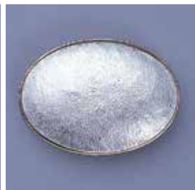
1832 小判型 35 × 25mm ¥1,100 ¥1,000 (ブローチ)