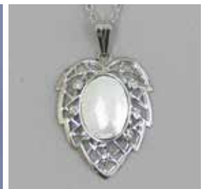
1834 小判型 10 × 13mm ¥990 ¥900 (シルバーメッキくさり付ペンダント)

絵画・画材 デザイン 工芸・民芸 版画・染色 木彫・木工芸 てん刻 彫塑・彫刻 陶芸 ガラス工芸 金属工芸 皮革工芸 七宝焼 資料 備品