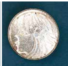
1712 横顔 φ 30mm ¥1,650 ¥1,500 (ブローチ)