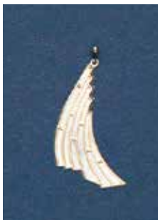
1820 模様 15 × 40mm ¥715 ¥650 (純銀ペンダント)