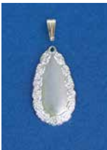
1805 しづくバラ 14 × 27mm ¥660 ¥600 (純銀ペンダント)