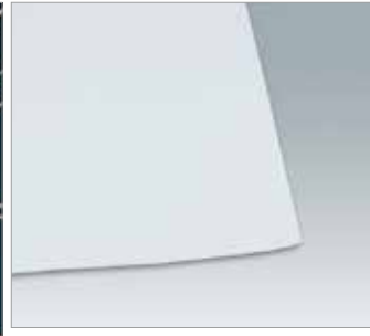
セラシート (離形紙) 6017 ----- ¥55 ¥50 175 × 175mm