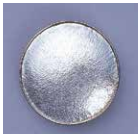
1831 丸型 φ 30mm ¥1,100 ¥1,000 (ブローチ)

銀板に表・裏共、銀白透加工（一回焼成済）を施してありますので、銀用・透明絵の具で直接彩色したり、有線七宝に使用できます。