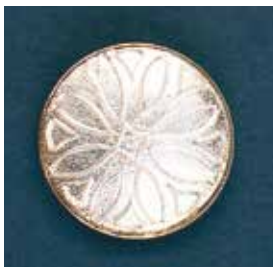
1711 花模様 φ 30mm ¥1,650 ¥1,500 (ブローチ)

下処理されたベースに銀線を立てて定着してあります。 銀用・透明絵の具を盛って2～3度焼成、仕上げで完成します。