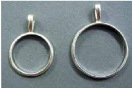
6014 有線ワク(小)純銀 ----- ¥2,090 ¥1,900 外径 18 線高 1,2mm

オナメントフリットや有線ワクを使って、透胎（胎のない）七宝ができます。ガラス細工のような透明感のある作品を創りましょう。