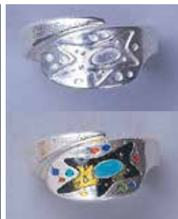
1827 星模様 φ 20mm ¥2,750 ¥2,500 (純銀リング) フリーサイズ