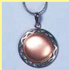
345 丸型 φ 15mm シルバー ¥880 ¥800