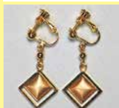
522 角型 8 × 8mm ゴールド ¥ 660 ¥ 600