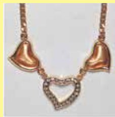
321 ハート型 16 × 10mm ゴールド ¥1,320 ¥1,200