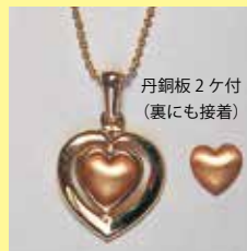
337 ハート型 10 × 9mm ゴールド ¥880 ¥800