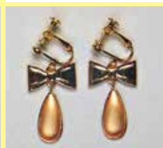
523 しずく型 8 × 18mm ゴールド ¥ 660 ¥ 600