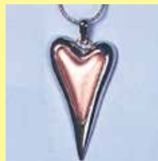
346 変形ハート型 12 × 20mm シルバー ¥880 ¥800