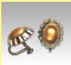
507 小判型 7 × 11mm シルバー ¥ 880 ¥ 800