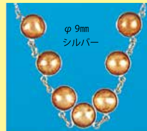
333 ペンダント φ 9mm シルバー ¥165 ¥150