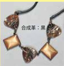
318 角型 15 × 21mm 金古美 ¥1,320 ¥1,200