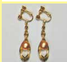
517 丸型 φ 8mm ゴールド ¥ 1,100 ¥ 1,000