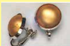
503 丸型 φ 15mm シルバー ¥ 550 ¥ 500