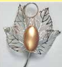
2502小判型 16 × 28mm シルバー ¥ 1,100 ¥1,000