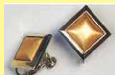
505 角型 12 × 12mm シルバー ¥ 550 ¥ 500