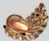
17小判型 24 × 9mm ゴールド ¥ 770 ¥700