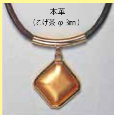
342 八角型 18 × 18mm ゴールド ¥880 ¥800