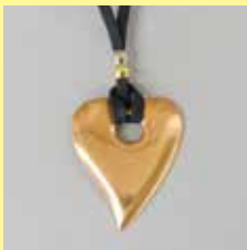
353 ハート型 40 × 47mm 紐黒 幅4mm ¥550 ¥500