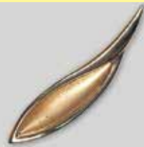
42波 50 × 10mm ゴールド ¥ 1,100 ¥1,000