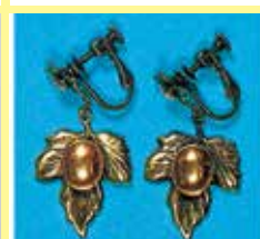
534 小判型 8 × 10mm 金古美 ¥ 165 ¥ 150