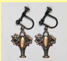
527 長小判型 3 × 9mm 金古美 ¥ 770 ¥ 700