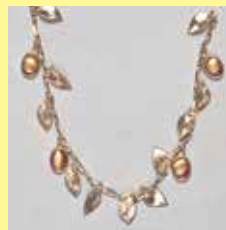
305 小判型 5 × 7mm 銀メッキ ¥880 ¥800