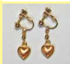
518 ハート型 10 × 9mm ゴールド ¥ 660 ¥ 600