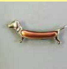
63犬 30 × 5mm シルバー ¥ 550 ¥500