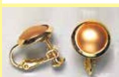
536 丸型 φ 10mm ゴールド ¥ 330 ¥ 300