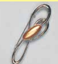
57小判型 24 × 9mm シルバー ¥ 880 ¥800