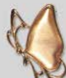
16ちょう 18 × 32mm ゴールド ¥ 550 ¥500