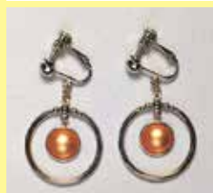
541 丸型 φ 10mm シルバー ¥ 880 ¥ 800