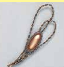
56小判型 24 × 9mm 金古美 ¥ 275 ¥250