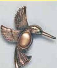
53小判型 9 × 15mm 金古美 ¥ 880 ¥800