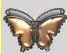
23ちょう 15 × 30mm 金古美 ¥ 550 ¥500