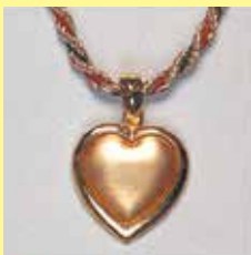
319 ハート型 24 × 21mm ゴールド ¥1,100 ¥1,000