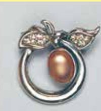
51小判型 10 × 13mm シルバー ¥ 1,100 ¥1,000