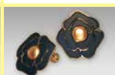
539 丸型 φ 6.5mm 黒 (金縁) ¥ 440 ¥ 400