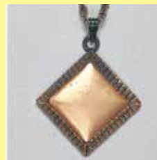
315 角型 24 × 24mm 金古美 ¥880 ¥800