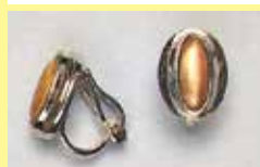
511 長小判型 3 × 9mm シルバー ¥ 495 ¥ 450