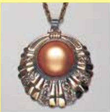
340 丸型 φ 19mm 金古美 ¥1,100 ¥1,000