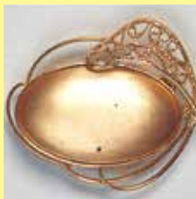
110長小判型 42 × 23mm ゴールド ¥ 1,100 ¥1,000