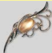
43小判型 13 × 20mm シルバー ¥ 1,100 ¥1,000