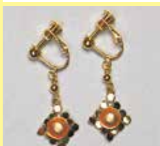
521 丸型 φ 6mm ゴールド ¥ 660 ¥ 600