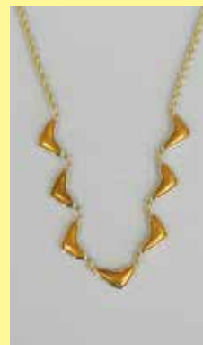
334 ペンダント 16 × 6mm ゴールド ¥165 ¥150