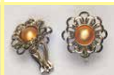
516 花・小丸型 φ 6mm シルバー ¥ 550 ¥ 500