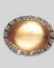
7小判型 32 × 23mm シルバー ¥ 550 ¥500