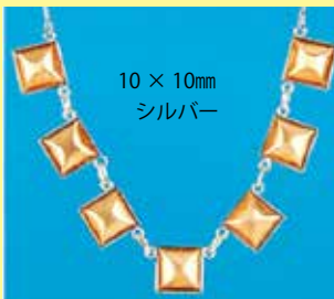
332 ペンダント 10 × 10mm シルバー ¥165 ¥150