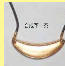
317 三日月型 70 × 15mm すみ入ゴールド ¥1,100 ¥1,000