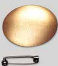
4小判型 42 × 31mm ¥ 330 ¥300