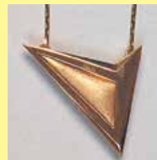
306 三角形 22 × 11mm ゴールド ¥880 ¥800