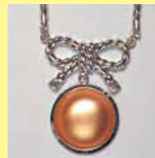
338 丸型 φ 19mm シルバー ¥1,100 ¥1,000