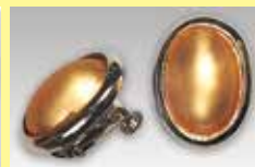
506 小判型 14 × 19mm シルバー ¥ 880 ¥ 800