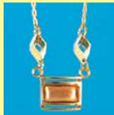
324 ペンダント 10 × 5mm ゴールド ¥165 ¥150