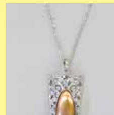
349 長小判型 9 × 24mm シルバー ¥880 ¥800