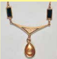
309 しずく型 8 × 12mm ゴールド ¥880 ¥800