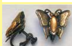
525 長小判型 3 × 9mm 金古美 ¥ 275 ¥ 250