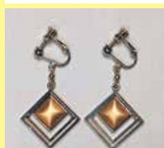
508 角型 10 × 10mm すみ入シルバー ¥ 880 ¥ 800