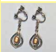
510 小判型 4 × 7mm シルバー ¥ 550 ¥ 500