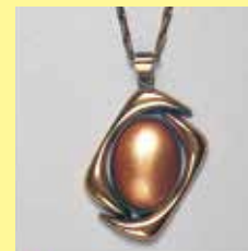
339 小判型 13 × 19mm 金古美 ¥880 ¥800