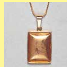
307 角型 13 × 17mm ゴールド ¥550 ¥500