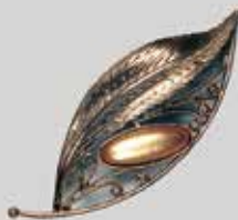
29長小判型 9 × 24mm 金古美 ¥ 880 ¥800