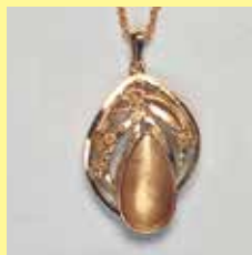
313 しずく型 14 × 26mm ゴールド ¥880 ¥800