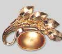
18小判型 19 × 14mm ゴールド ¥ 770 ¥700