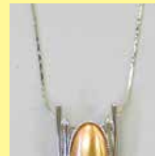
350 長小判型 10 × 20mm シルバー ¥880 ¥800