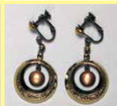
543 丸型 φ 10mm 金古美 ¥ 880 ¥ 800