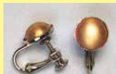
501 丸型 φ 10mm シルバー ¥ 330 ¥ 300