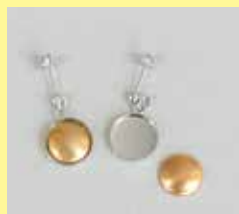
561 ピアス丸型 φ 12mm シルバー ¥ 330 ¥ 300