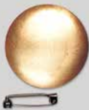
3丸型 φ 42mm ¥ 330 ¥300