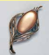
54小判型 17 × 31mm 金古美 ¥ 880 ¥800