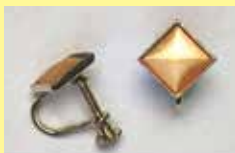
502 角型 8 × 8mm シルバー ¥ 330 ¥ 300