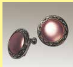
544 丸型 φ 15mm シルバー ¥ 440 ¥ 400