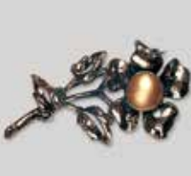
28丸型 φ 10mm 金古美 ¥ 550 ¥500