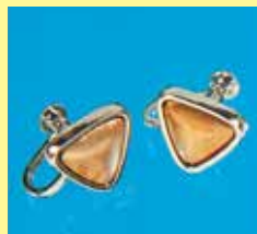
530 三角 11 × 11mm シルバー ¥ 165 ¥ 150