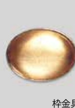
6小判型 32 × 23mm シルバー ¥ 330 ¥300