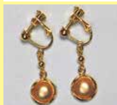
519 丸型 φ 8mm ゴールド ¥ 880 ¥ 800