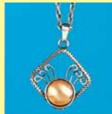
329 ペンダント φ 10mm 銀古美 ¥165 ¥150