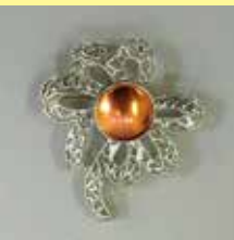
61丸型 φ 18mm シルバー ¥ 880 ¥800