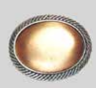
19小判型 32 × 23mm 銀古美 ¥ 550 ¥500