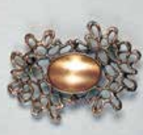
26小判型 19 × 14mm 金古美 ¥ 550 ¥500