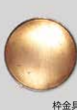
5丸型 φ 32mm シルバー ¥ 330 ¥300