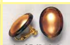
540 小判型 14 × 19mm ¥ 275 ¥ 250