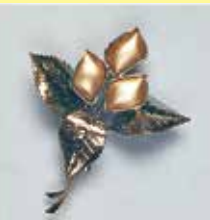
49花 8 × 10mm 金古美 ¥ 880 ¥800