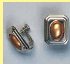
1132 小判型 10 × 13mm シルバー ¥ 275 ¥ 250