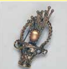
52小判型 7 × 11mm 金古美 ¥ 880 ¥800