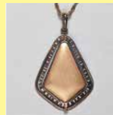
316 変形角型 27 × 38mm 金古美 ¥880 ¥800