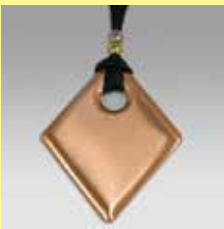
344 穴あきひし型 52 × 66mm 紐黒 幅4mm ¥550 ¥500