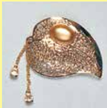
55小判型 9 × 13mm ゴールド ¥ 275 ¥250