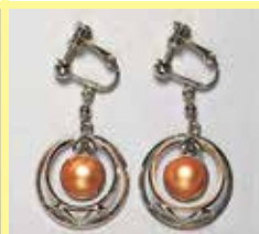
542 丸型 φ 10mm シルバー ¥ 880 ¥ 800