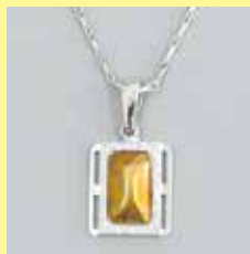
304 角型 8 × 13mm シルバー ¥880 ¥800