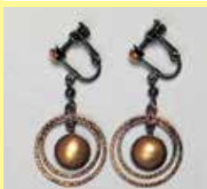
528 丸型 φ 10mm 銅古美 ¥ 770 ¥ 700