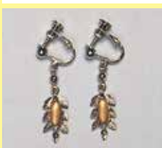
509 長小判型 3 × 9mm シルバー ¥ 550 ¥ 500