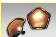
537 五角形 一辺 14mm 金古美 ¥ 660 ¥ 600