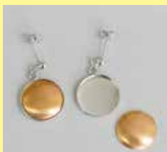
562 ピアス丸型 φ 15mm シルバー ¥ 330 ¥ 300