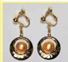
524 丸型 φ 10mm ゴールド ¥ 880 ¥ 800