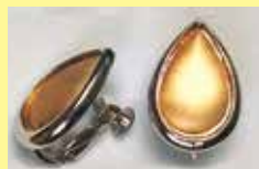
504 しずく型 11 × 17mm シルバー ¥ 550 ¥ 500