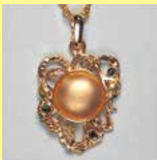
312 丸型 φ 20mm ゴールド ¥1,100 ¥1,000