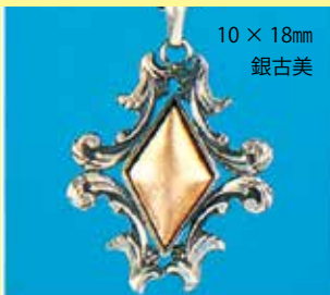
330 ペンダント 10 × 18mm 銀古美 ¥165 ¥150