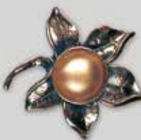
27丸型 φ 18mm 金古美 ¥ 550 ¥500