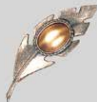
22小判型 19 × 14mm 銀古美 ¥ 550 ¥500