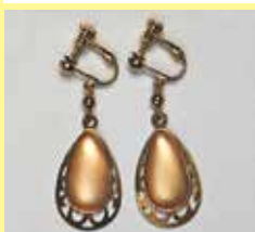
520 しずく型 11 × 21mm すみ入シルバー ¥ 880 ¥ 800