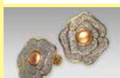
538 丸型 φ 6.5mm シルバー (金縁) ¥ 440 ¥ 400