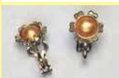
512 花・小丸型 φ 6mm シルバー ¥ 550 ¥ 500