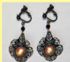
526 丸型 φ 10mm 金古美 ¥ 770 ¥ 700