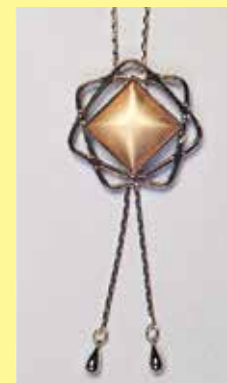
821 角型 15 × 15mm シルバー ¥1,100 ¥1,000