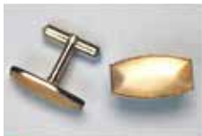
1002 たる型 20 × 10mm シルバー ¥550 ¥500