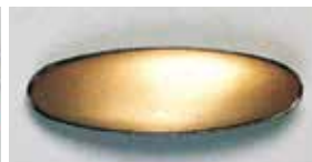
858 小判型 ¥660 ¥600 61 × 16mm 黒