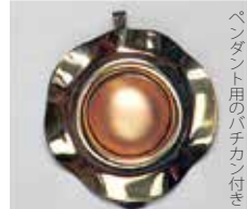
841 丸型 φ 20mm 金古美 ¥660 ¥600