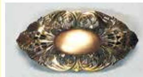
859 小判型 17 × 30mm 金古美 ¥550 ¥500