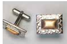
1007 角型 11 × 6mm シルバー ¥990 ¥900