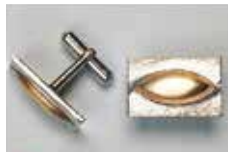
1004 長小判型 17 × 7mm シルバー ¥660 ¥600