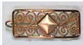
804 角型 8 × 8mm すみ入ゴールド ¥550 ¥500