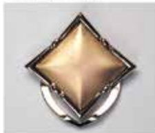
811 角型 20 × 20mm シルバー ¥660 ¥600