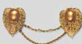
864 丸型 φ 8mm ----- ¥550 ¥500 865 小判型 10 × 8mm - ¥550 ¥500 ダイヤ巻き ピン全長 65mm ゴールド