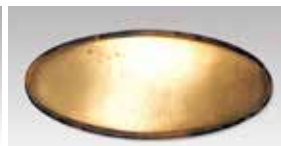
854 長小判型 84 × 34mm ベッコウ風プラスチック ¥550 ¥500