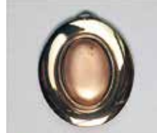
842 小判型 17 × 25mm 金古美 ¥660 ¥600