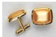
1012 たる型 15 × 12mm ゴールド ¥660 ¥600