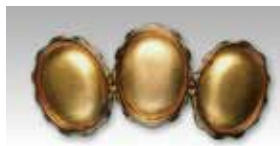
852 三連小判型 23 × 31mm ゴールド ¥275 ¥250