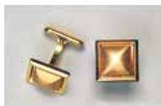
1009 角型 10 × 10mm ゴールド ¥660 ¥600