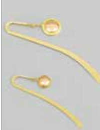
1522 丸型小ゴールド φ 12mm 全長 85mm ¥440 ¥400