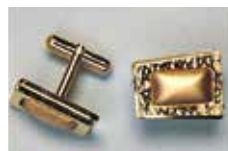
1010 カフス 13 × 8mm ゴールド ¥275 ¥250