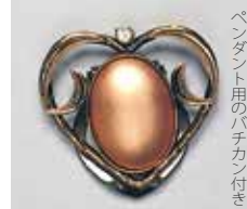
843 小判型 18 × 24mm 金古美 ¥660 ¥600