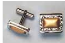
1006 カフス 13 × 8mm シルバー ¥275 ¥250