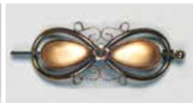
803 しずく型 22 × 11mm 金古美 ¥880 ¥800