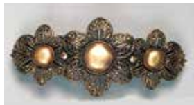
860 丸型 φ 14mm φ 9mm 金古美 ¥660 ¥600