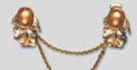
817 ツインタック 小判型 13 × 10mm ゴールド ¥1,100 ¥1,000