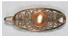
805 丸型 φ 10mm すみ入ゴールド ¥550 ¥500