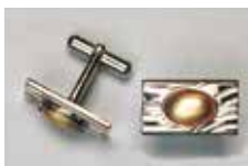
1008 小判型 11 × 7mm シルバー ¥990 ¥900