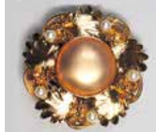
812 丸型 φ 20mm すみ入ゴールド ¥660 ¥600