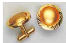
1011 丸型 φ 15mm ゴールド ¥660 ¥600