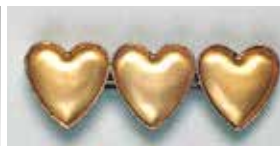
857 ハート型 23 × 20mm シルバー ¥275 ¥250