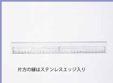
片方の縁はステンレスエッジ入り